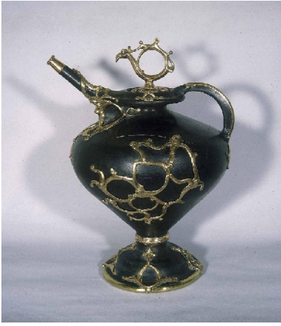
La cruche celte de Brno