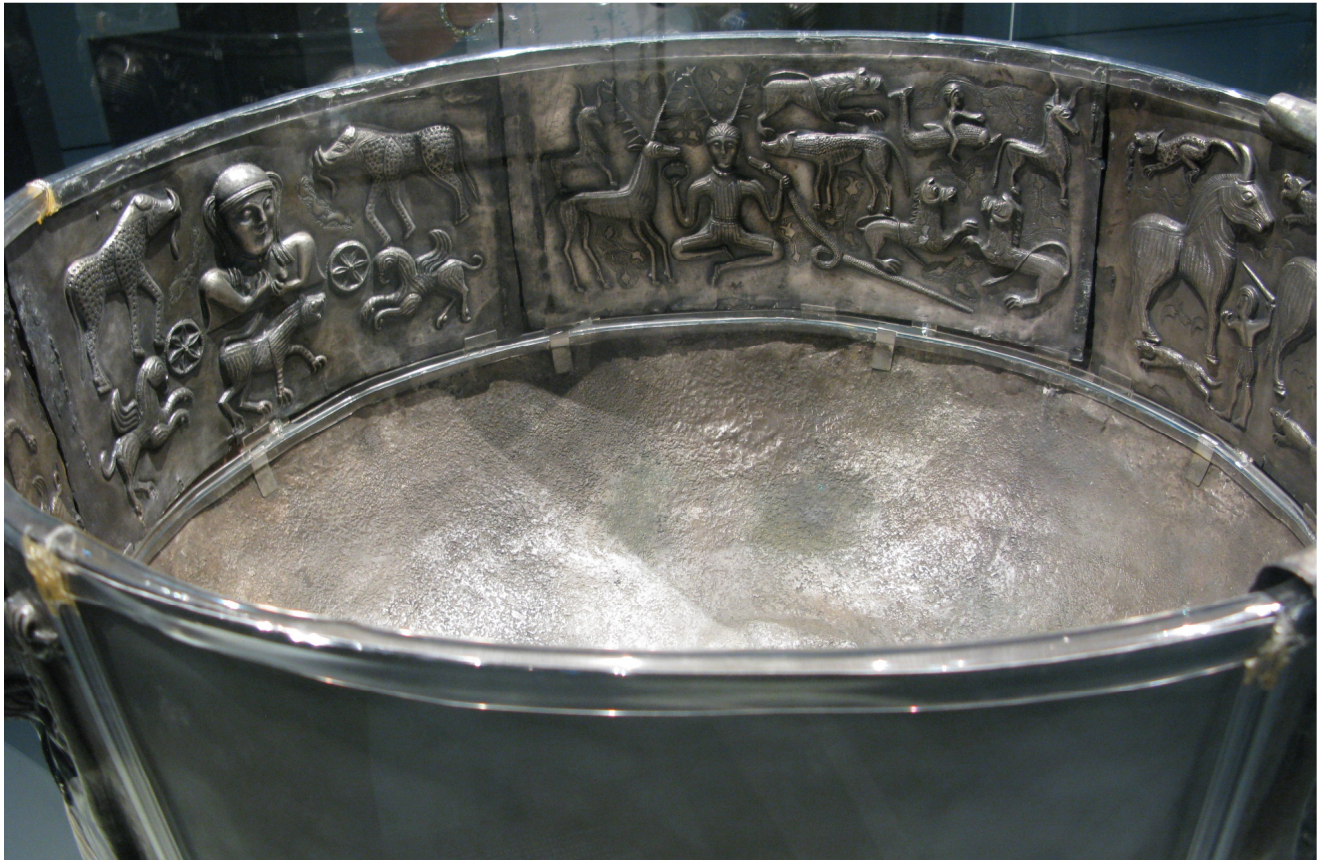
Intérieur du chaudron de Gundestrup

constitue avec le personnage divin aux bois de cerf une seule et même entité ou s'il est son nécessaire complément.