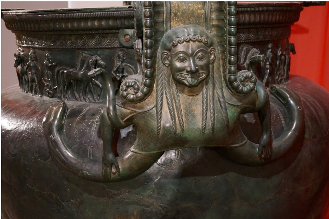
Le Cratère de Vix – anse décorée d'une Gorgone

vieille mythologie irlandaise jusqu'à la tradition médiévale (ainsi qu'en témoignent le Garganeüs du XII e siècle et Mélusine). L'examen de la mythologie celtique de l'anguille et le recours à une approche pluridisciplinaire (archéologie, mythologie, philologie, zoologie) autoriseraient-ils alors quelques hypothèses sur la présence de cette figure dans la tombe de la princesse de Vix ?