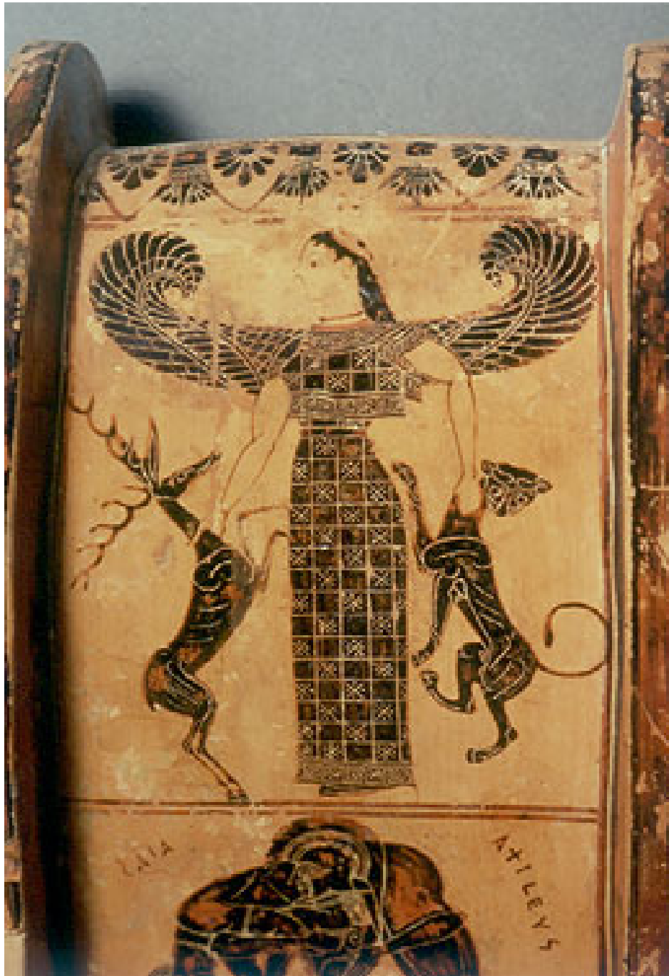
Arthémis sous les traits de Potnia-Theron la « maîtresse des animaux » détail de vase à figure noire (570-560 av. J.-C.) musée archéologique de Florence

3- Le problème de la correspondance observée entre la représentation gauloise du Maître des animaux et celle qui figure dans la civilisation de l'Indus s'explique par une présence indo-européenne pré-aryenne dans cette civilisation.